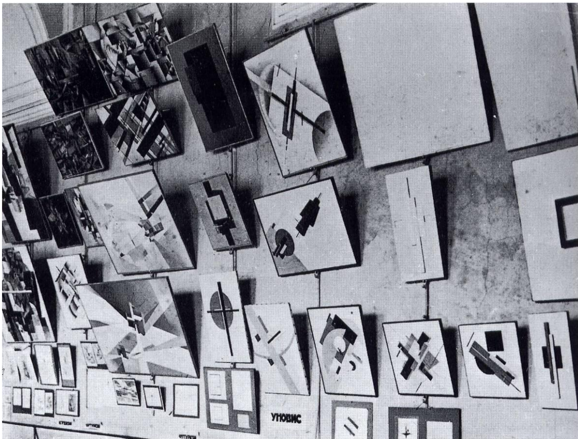
Рис. 5. Выставка петроградских художников всех направлений. Фрагмент экспозиции. Петроград, 17 мая – 1 августа 1923 г. [6, с. 326].