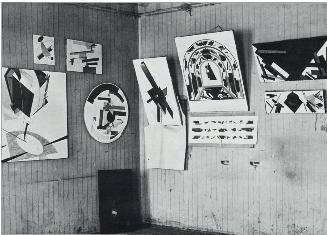
Рис. 2. Выставка художественных мастерских Витебска, Оренбурга и Москвы. Фрагмент экспозиции. Москва, май-июнь 1921 г. [6, с. 325].